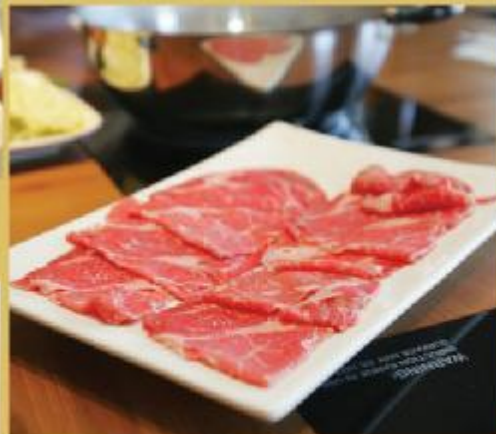
● 涮涮鍋的優質牛肉。The highest quality beef. Available at Halu Shabu Shabu.