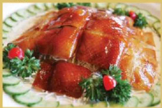
● 中式烤鴨。 Chinese barbecue dishes. Available at Just Koi Chinese BBQ & Noodle House.