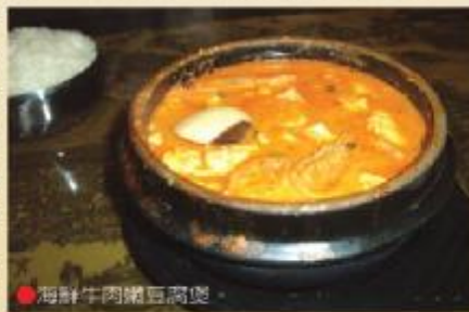
●海鮮牛肉嫩豆腐煲。

煲和海鮮牛肉嫩豆腐煲，每樣豆腐煲都讓客人讚不絕口；而且辣味由客人自己挑選。特別的是，這裡的豆腐是由韓國豆腐坊當天清晨製作並運送進來，非常新鮮。