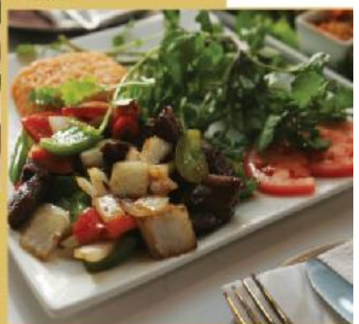
● 法式越南美食。French-Vietnamese cuisine. Available at Vin Pearl Fine Vietnamese Cuisine.