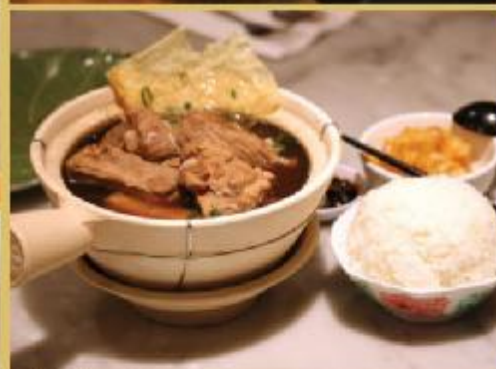
● 新加坡肉骨茶。Bak Kut Teh. Available at Singapore Old Town Cafe.