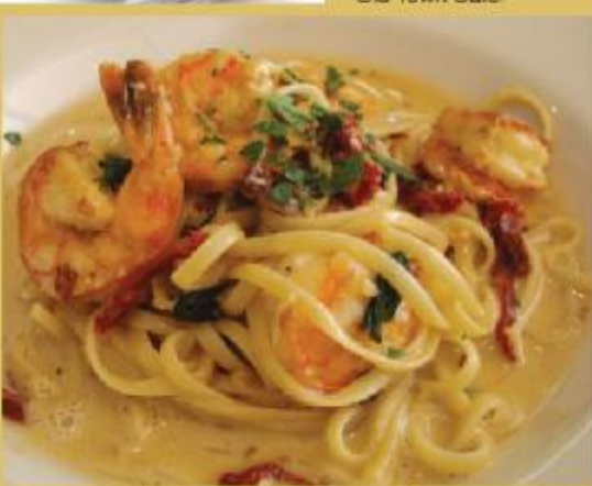
● 加州義大利風美食。Linguini with grilled shrimps tossed in a light garlic creamsauce. Available at Abba Gourmet Italian Grill.