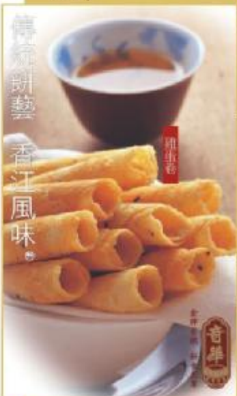
● 高華餅家的蛋撻。 Eggroll. Available at Kee Wah Bakery.